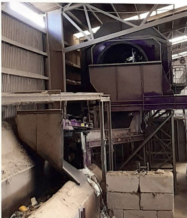
PARO verwerkt bouw- en sloopafval tot deelstromen, residuen of hoogwaardige secundaire bouwstoffen.

PARO krijgt per dag zo'n 800 ton aan bouw- en sloopafval binnen. Een gigantische hoeveelheid, die verwerkt, gesorteerd en gerecycled moet worden. Handmatig en machinaal. Met allemaal één gemene deler: de transportbanden van REMA TIP TOP TSN. Severijns: "Het is een vrijwel continue proces, waarbij we ons nauwelijks een stilstand kunnen veroorloven. Hierbij blijven we als bedrijf uiteindelijk ook afhankelijk van onze mensen. We kunnen nog zo'n goede inten-