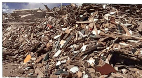
PARO krijgt per dag zo'n 800 ton aan bouw- en sloopafval binnen.

ties hebben, maar als de medewerkers niet weten wat ze moeten doen of niet goed worden begeleid c.q. opgeleid, dan kan het toch nog mis gaan." Eijking vult hem aan: "Dit geldt uiteraard ook voor onze monteurs. "Wij zorgen voor de juiste opleidingen en professioneel gereedschap. Dat werkt een stuk prettiger."