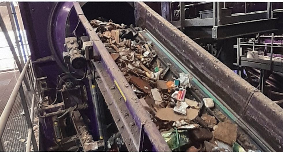
Overal waar transportbanden nodig zijn, heeft REMA TIP TOP TSN haar eigen specialisme en specifieke aanpak.

Eijking en Severijns zijn twee ouwe rotten in het vak en kennen elkaar al enkele tientallen jaren. “We weten precies wat we aan elkaar hebben en dit helpt zeker als er wat moet worden gerepareerd of